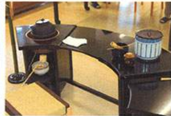
お茶や和菓子の味を春と共に楽しんでいただきました。