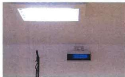
紫外線殺菌装置エアロシールド