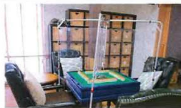
大人気の麻雀にも 安心のパーテーション