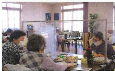
製作時も安心して取組めます！！

陽だまりサロン碧では、ご利用時にマスクの着用をお願いしております。皆様のご理解・ご協力には大変感謝しております。全座席に飛沫防止パーテーションの設置・紫外線殺菌装置エアロシールドを2基設置しております。 皆様に、大人気の麻雀台にもパーテーションを設置しておりますので安心してご遊戯頂けます！楽しいお時間を「ごゆっくりとお過ごし下さいませ。」