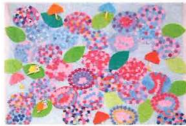
壁面製作『彩り豊かな紫陽花』

こんにちは！皆様、コロナ禍の中、不自由な日々を送られている事と思いますが、いかがお過ごしでしょうか？コロナが一刻も早く収束して、皆様に穏やかな日常が戻りますよう・・・願っております。 コロナ禍ではございますが、陽だまりサロン碧は多くの皆様に支えられまして、おかげ様で七月一日（木）でオープンから二年目を迎えることとなりました。これからも、皆様がお元気で若々しく日々を過ごされますよう、スタッフ一同、『幸せ』のお手伝いを少しでも出来ましたら幸いです！今後とも、宜しくお願い致します。スタッフ一同より